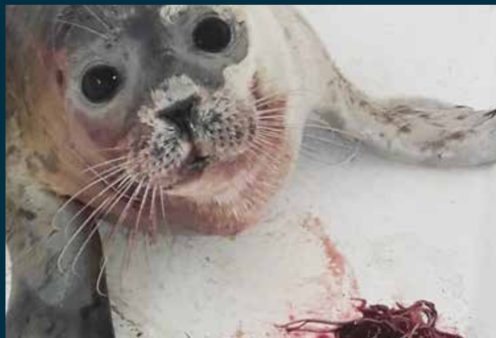
Deze zeehond heeft longwormen opgehoest.

Als een dier op tijd gevonden wordt kan het behandeld worden. Een zeehond met een longworm infectie is te herkennen aan verschijnselen als een moeizame ademhaling, hoge rug en een bebloede bek. De gemiddelde opvangperiode van een zeehond met een longworminfectie is twee tot drie maanden. Wanneer een zeehond eenmaal genezen is, is hij verder resistent voor deze parasitaire infectie